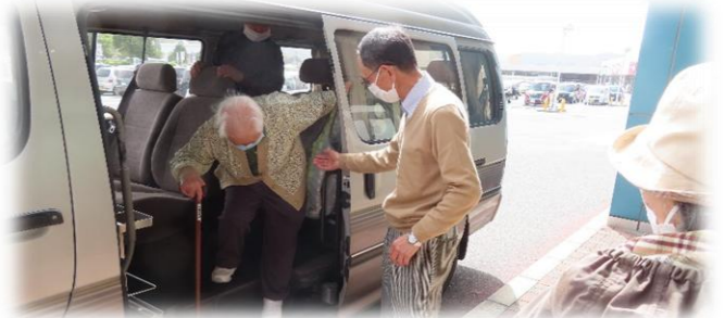
高齢者の方の通院や買い物などの外出支援