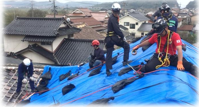
災害時の被災地の復興支援活動