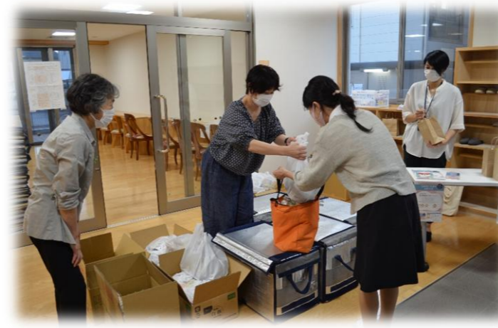
ひとり親家庭への支援（食品などの物品提供活動）