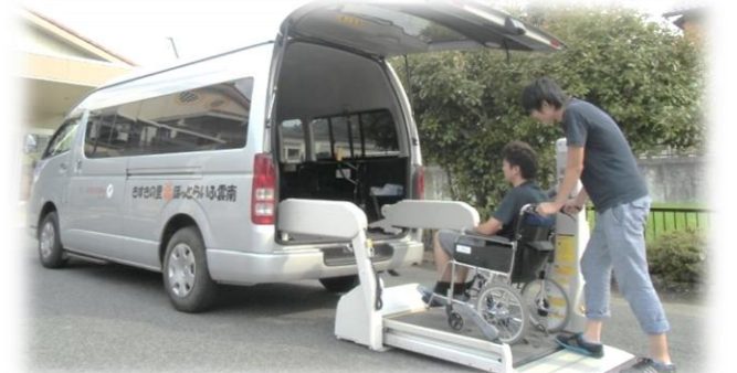
障がい者施設へ車いすのまま乗れる車を