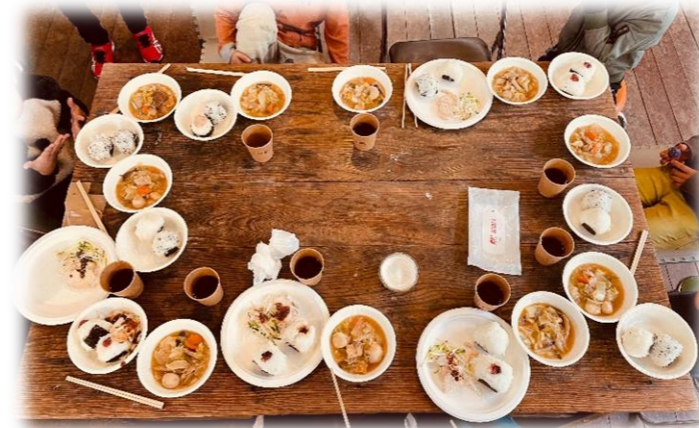
子ども食堂の支援