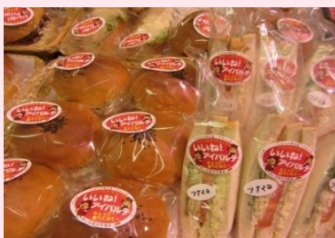
(有)白銀屋商店 (アイパルテ) (松江市)

道の駅「たたらば壱番地」で販売する鯖寿司の売り上げの一部を赤い羽根共同募金に寄付し雲南の地域福祉を支援しています。