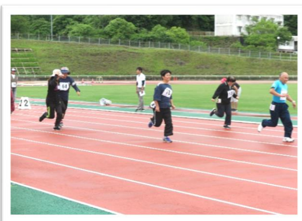
障がい者スポーツ大会

募金百貨店プロジェクトに参加を希望される方は、島根県共同募金会にご連絡ください。寄付金付き商品の企画を共同募金会が共にプランニングしていきます。また、寄付先は島根県共同募金会、各市町村の共同募金会、または複数の市町村共同募金会などお選びいただけます。