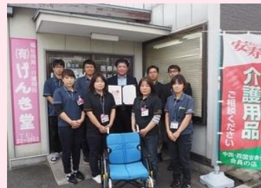
有限会社げんき堂 (安来市)

「アイパルテ」で販売する「いいね！アイパルテ」シール付き商品の売り上げの一部を赤い羽根共同募金に寄付し松江市の福祉を支援しています。