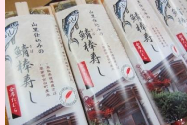
会席たむら (雲南市)

割子そばを注文いただくと売り上げの一部を赤い羽根共同募金に寄付し島根県の地域福祉を支援しています。