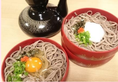
そば処かねや (出雲市)